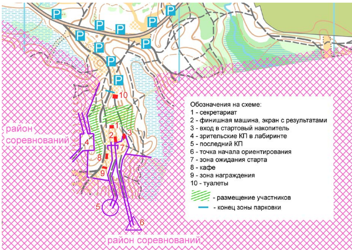
Схема центра соревнований:

В центре соревнований будет работать кафе. В случае дождливой погоды будут установлены навесы для переодевания. Рекомендуется установка клубных шатров для размещения.