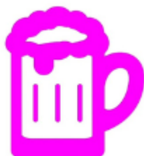
Рисунок 1 - новый символ для пункта подпитки

Дистанция будет проходить в соответствии с правилами дисциплины «Кросс-классика-общий старт» в ночных условиях, но с некоторыми доработками. При входе в накопитель за минуту до старта каждому участнику выдается тара со слабоалкогольным пенистым напитком, выдаются карты по номерам, участники проходят дистанцию в два круга с рассеиванием, производя повторную подпитку живительной влагой на смене карт.