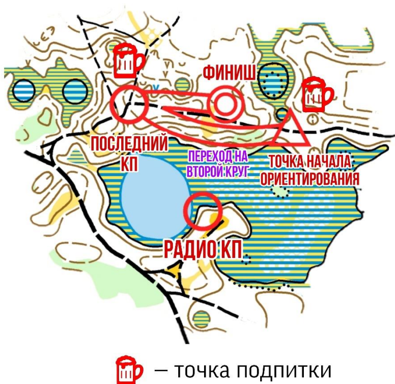
СХЕМА АРЕНЫ НОЧНОГО