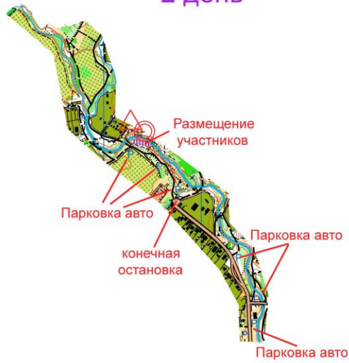
Схема старта и финиша 23 февраля 2025 года 3 день

Схема старта и финиша 22.02.2025 г. 2 день